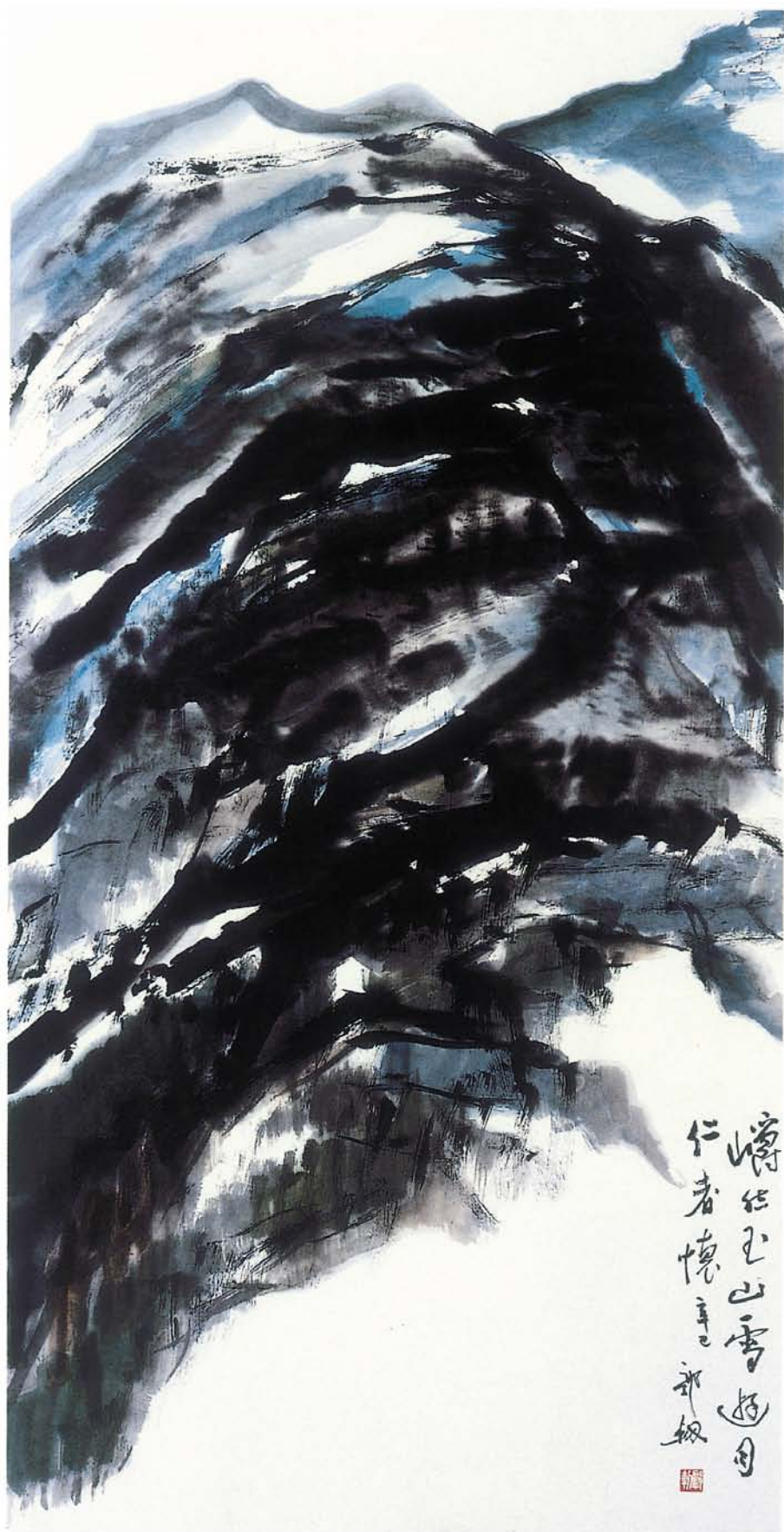
愛山近乎仁 主軸（水墨）宣紙 全開（2×4尺） 2001