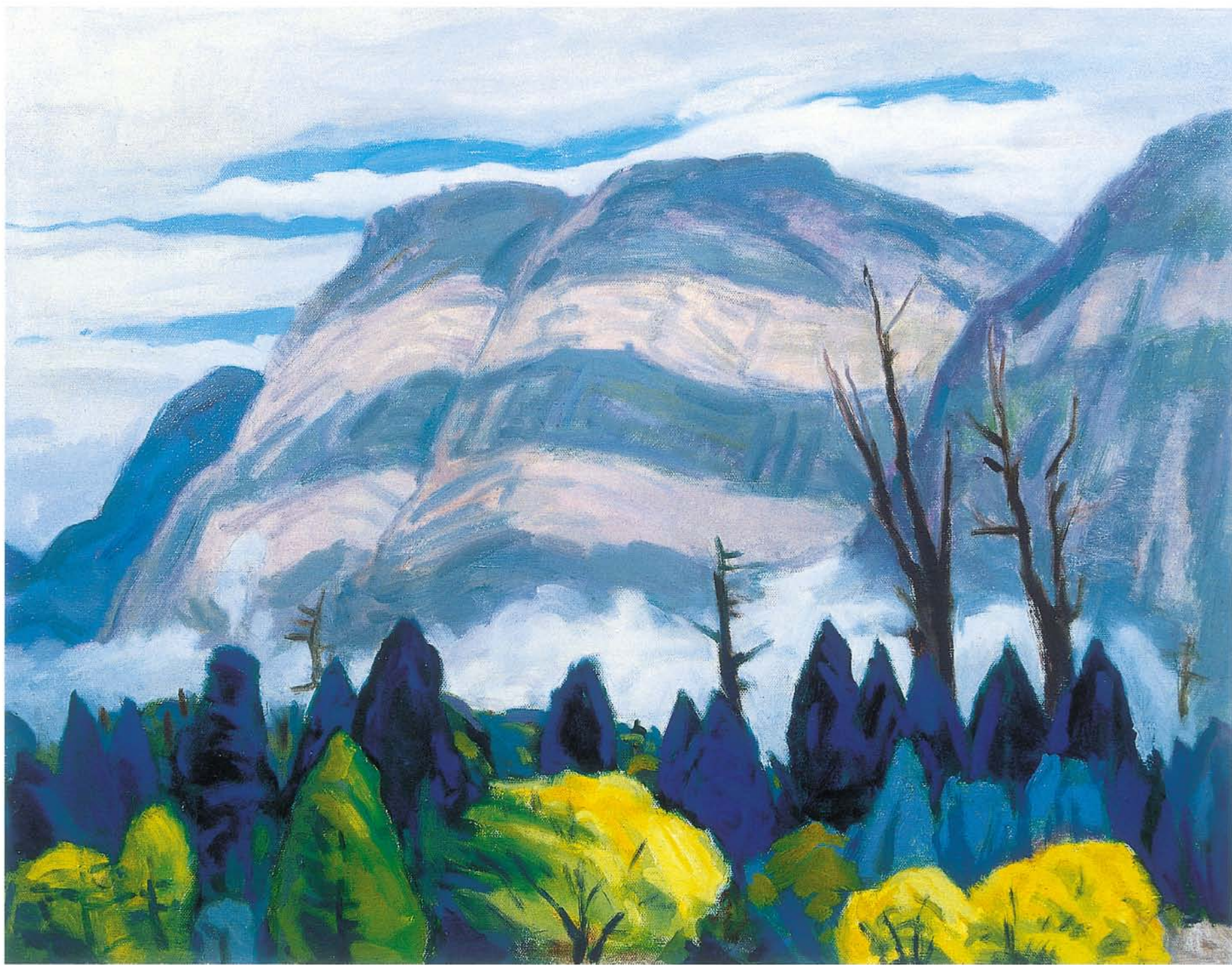
塔山震後新面貌 油彩 12P 2001