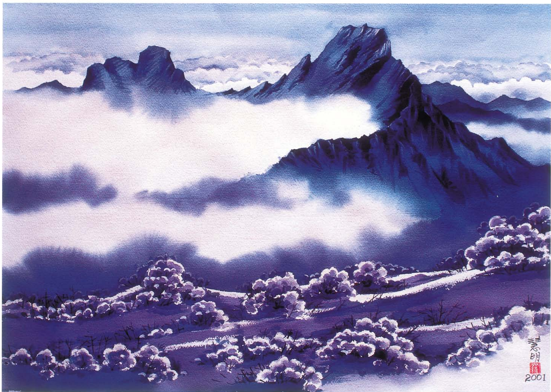
玉山主峰及東峰 水彩 56×76cm 2001