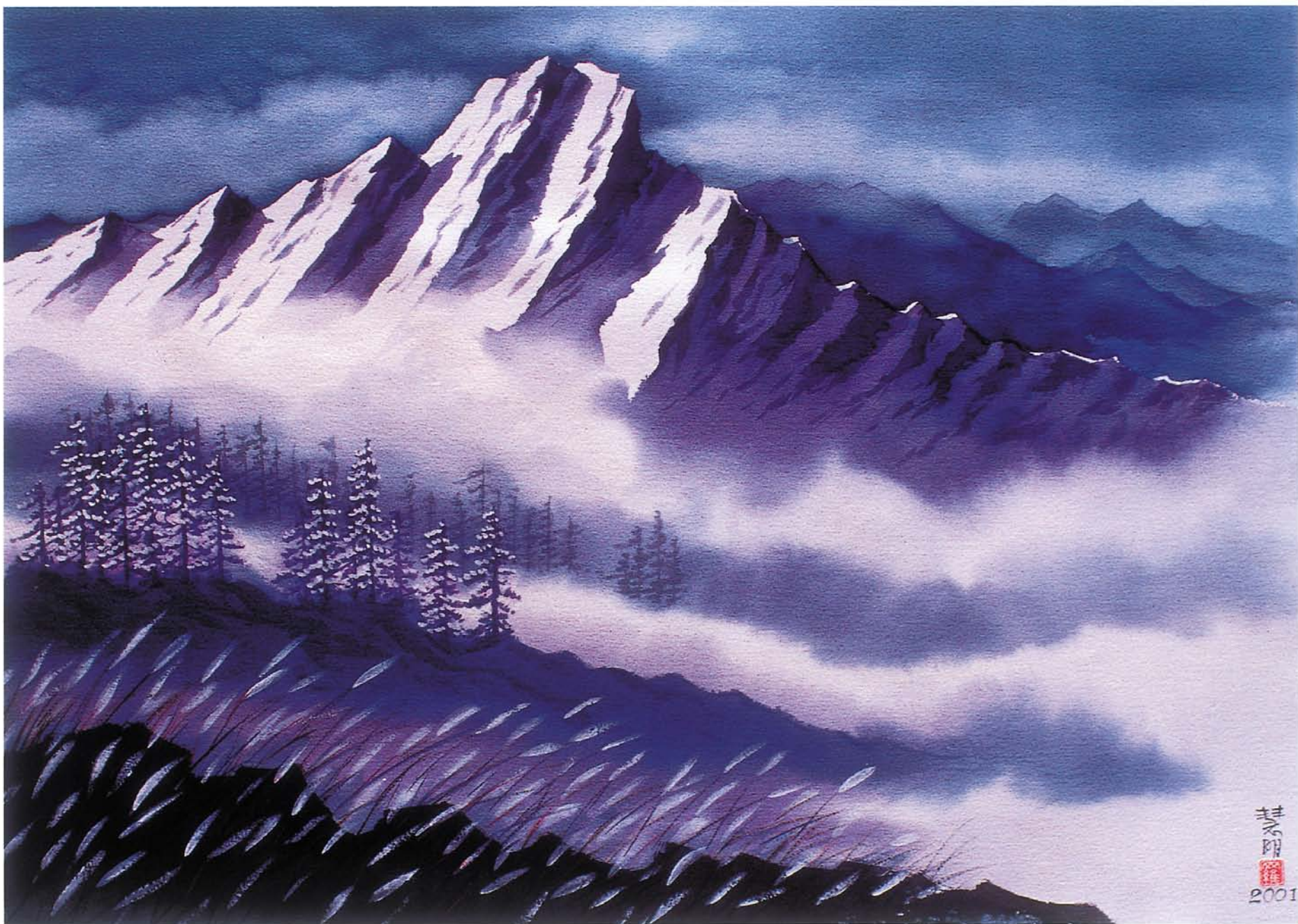
玉山瑞雪 水彩 56×76cm 2001