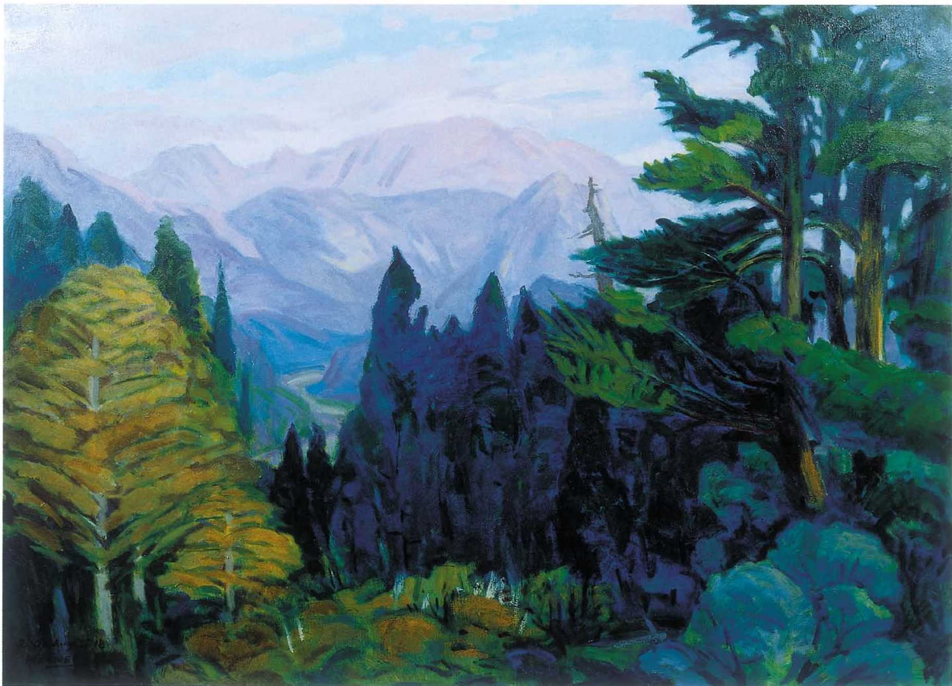
鹿林拂曉朝露深 油彩 30P 2001