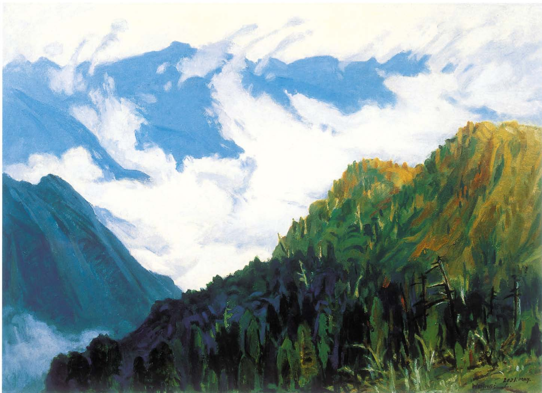
午後山嵐起舞時 油彩 30P 2001