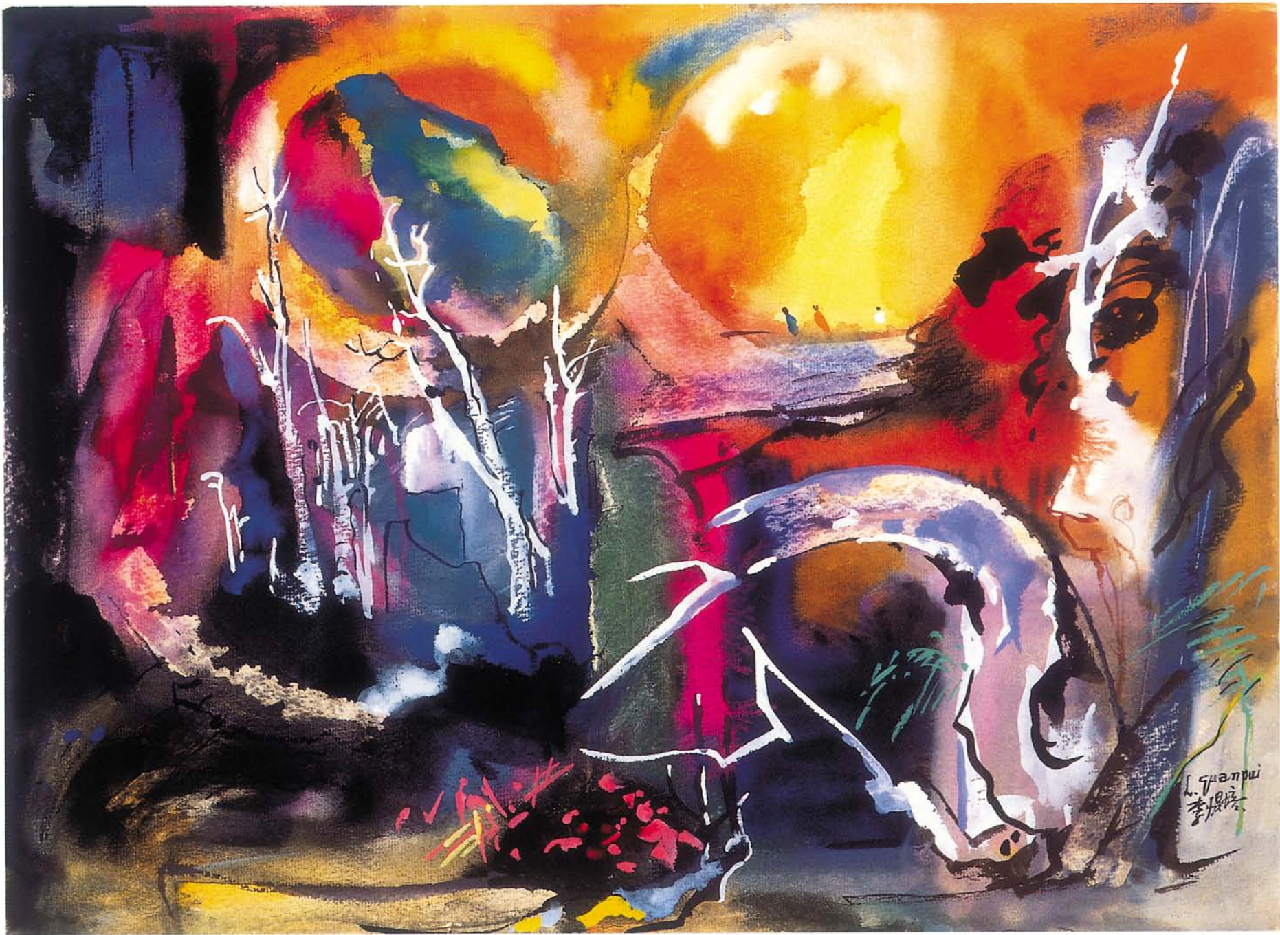
玉山隨想 ( I ) 水彩 ( 透明 · 不透明彩 ) 38.5 × 53cm 2001