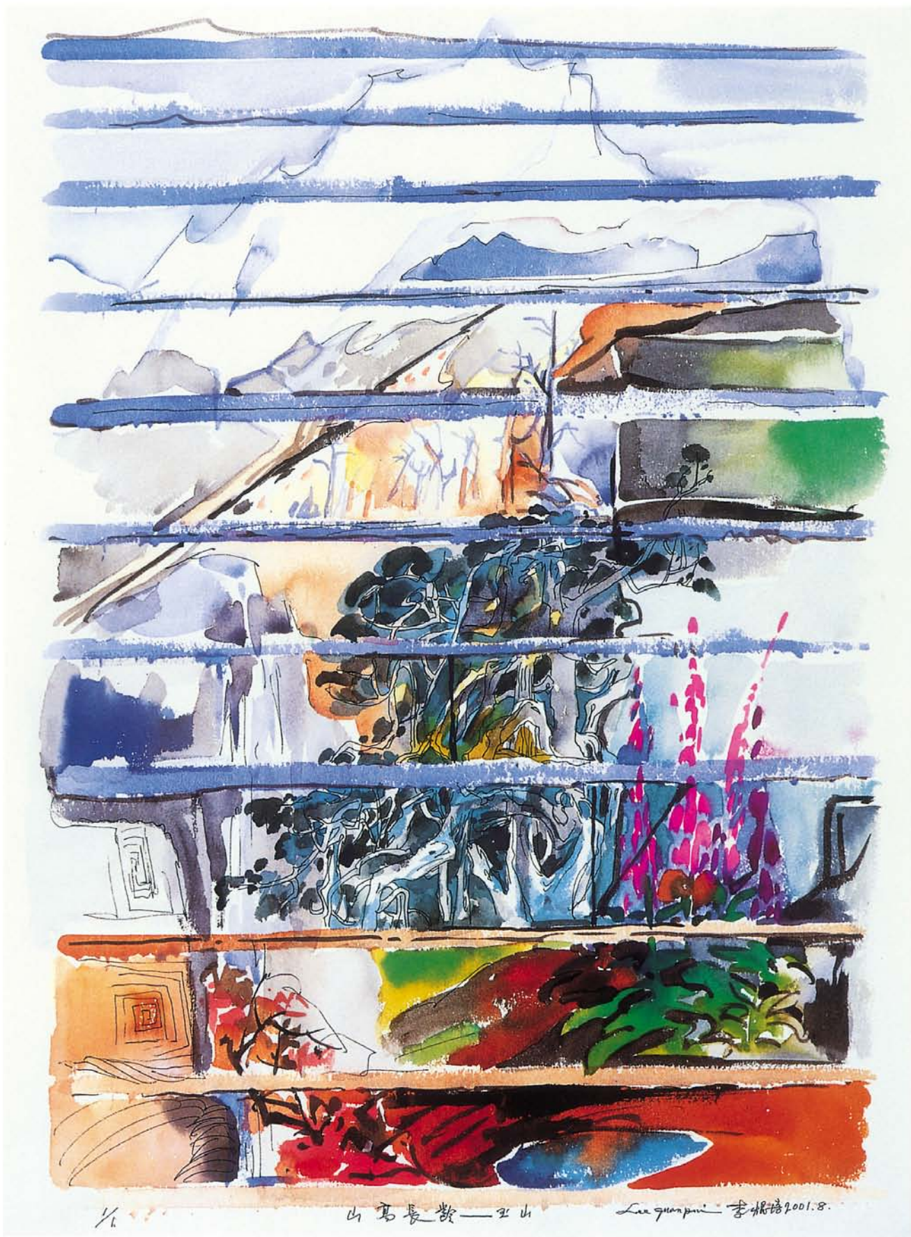
山高長齡—玉山 水彩·針筆·水彩紙 76×56cm 2001