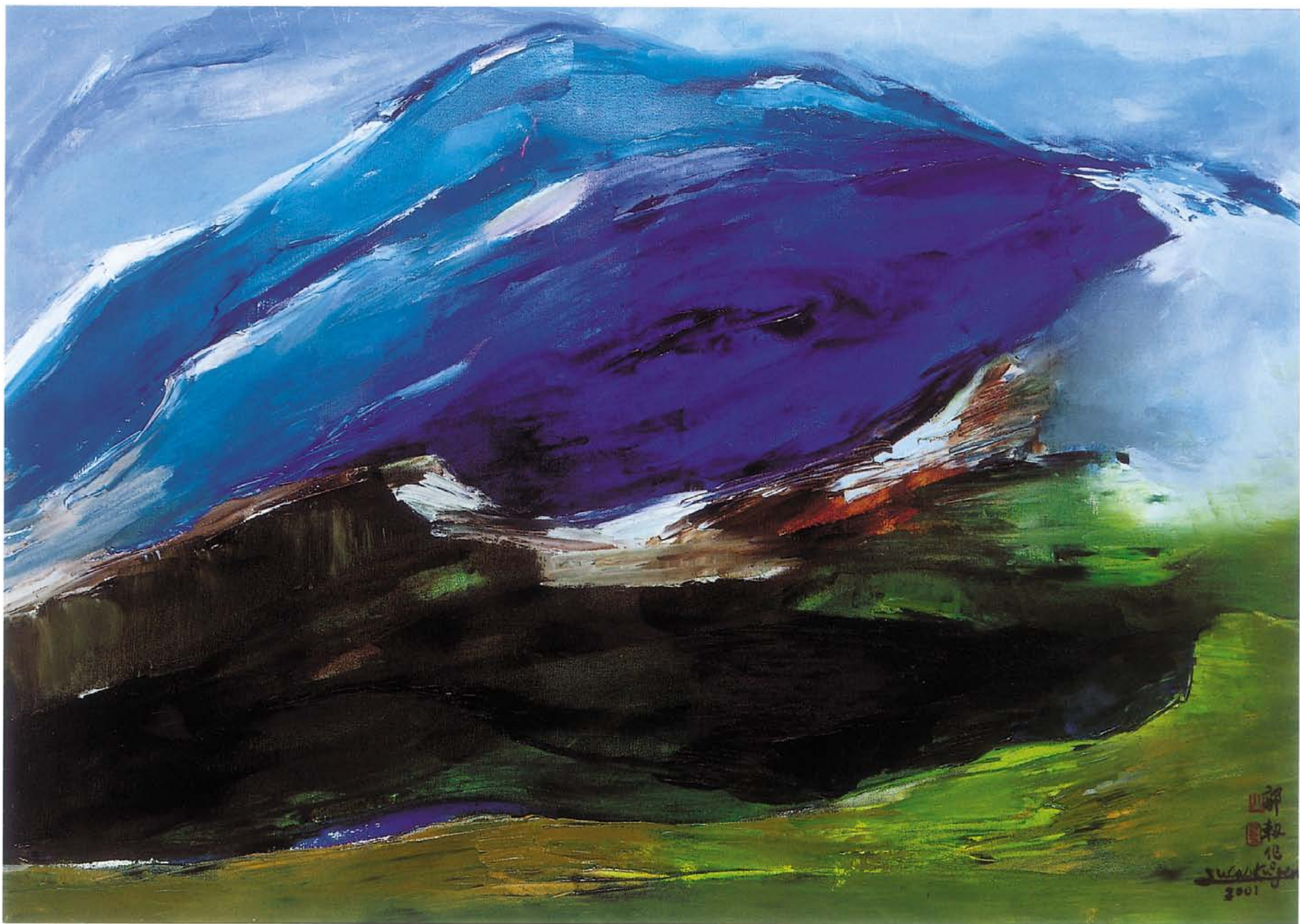
玉山諸峰 油畫 30P 2001