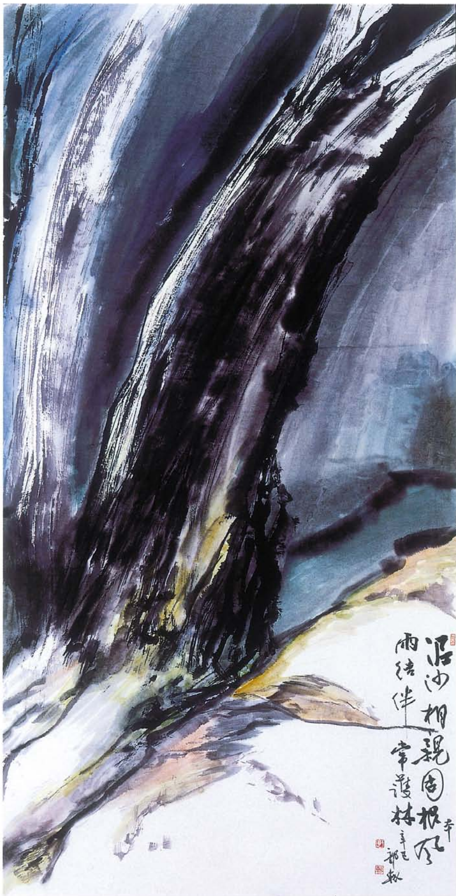
守常道 主軸裱（水墨）宣紙 全開（2×4尺） 2001