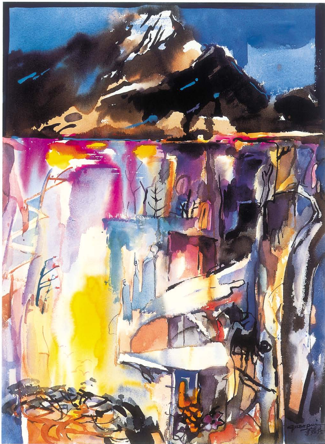
玉山隨想 (II) 水彩 (透明·不透明彩) 38.5×53cm 2001